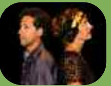
Chansons d'amour pour ton bébé