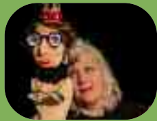
La princesse qui n'aimait pas