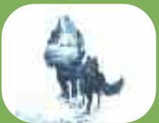
Construire un feu