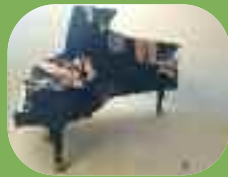
J'ai dormi près d'un arbre