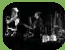
Restos du coeur