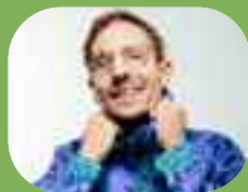
A. Le Rossignol