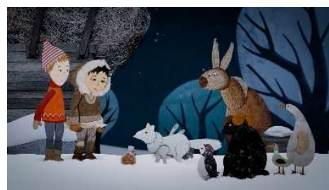
Neige d'Antoine Lanciaux et Sophie Roze

Projection en salle du film Neige et les arbres magiques , programmé pour Maternelle au cinéma , (durée de 50 minutes), suivi d'un échange animé par Juliette (durée 30 minutes).